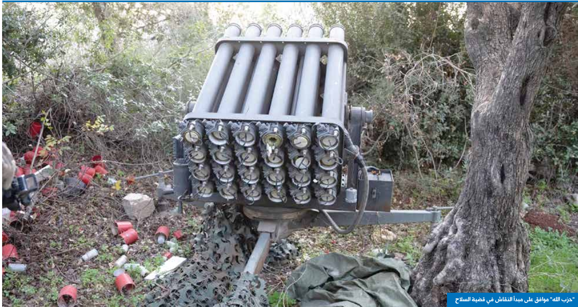
"حزب الله" موافق على مبدأ النقاش في قضية السلاح

ان السادة المساهمين مدعوون لحضور الجمعية العمومية العادية السنوية التي ستعقد نهار الخميس في 15 آيار 2025 الساعة الرابعة من بعد الظهر في مركز الشركة الرئيسي الكائن في الحازمية بناية زغزغي وذلك للتداول في جدول الأعمال التالي: 1- الاستماع إلى تقارير مجلس الإدارة العامة عن أعمال وحسابات السنوات المالية 2020 و2021 و2022 والتقارير الخاصة المنصوص عنها في المادة 158/ تجارة. 2- الاستماع إلى تقارير مفوض المراقبة العامة عن أعمال وحسابات السنوات المالية 2020 و2021 و2022 والتقارير الخاصة المنصوص عنها في المادة 158/ تجارة. 3- مناقشة أعمال وحسابات السنوات المالية 2020 و2021 و2022. 4- إبراء ذمة رئيس وأعضاء مجلس الإدارة عن إدارتهم للشركة خلال السنوات المالية 2020 و2021 و2022. 5- المصادقة على التراخيص الممنوحة من قبل مجلس الإدارة بموجب المادة 158/ تجارة. 6- إعطاء الترخيص المنصوص عنه في المادة 159/ تجارة. 7- الموافقة على الأعمال التي قام بها مفوض المراقبة خلال السنوات المالية 2020 و2022. 8- تعيين مفوض مراقبة للجنة المالية 2023 وتحديد بدل اتعابه. 9- انتخاب أعضاء مجلس إدارة الشركة. 10- أمور مختلفة. يحق لكل مساهم حضور الجمعية او أن يتمثل بوكيل من المساهمين أو من الغير. إن الوكالات يجب إيداعها قبل اسبوع من تاريخ الجلسة.