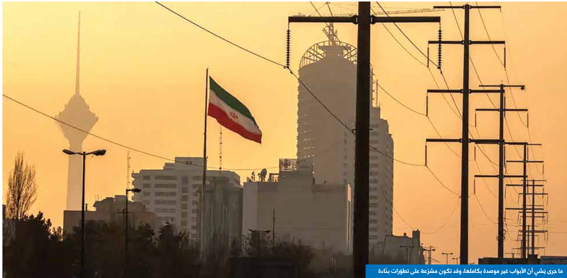
ما جرى يشي أن الأبواب غير موصدة بكاملها، وقد تكون مشرّعة على تطوّرات بناءة

الشروط الاقتصادية، وخصوصاً في مجال النفط، أو الحرب الشاملة عليها، ليصبح مصير نظامها كمصير نظام الأسد. خابت توقعات نتنياهو الذي يُصّر على المشاغبة على محاولة تسوية بين واشنطن وطهران. في نهاية الجولة الأولى كان هناك تقدير مزدوج للدور الذي اضطلعت به السلطنة، عندما استجاب الطرفان الأميركي والإيراني لتمني الوسيط العماني بالخروج من القاعة بالتزامن عبر باب واحد، مع حصول مصافحة ودرشة لم تتجاوز الدقيقة الواحدة، لكنها قد تُؤشّر إلى جو مريح ساد المحادثات ربما لا يكون كافياً لاستباق مآلاتها. إلا أن ما جرى يشي أن الأبواب غير موصدة بكاملها. وقد تكون مشرّعة على تطوّرات بناءة يمكن تطويرها وتعزيرها في ما بعد، من دون إسقاط احتمال «الكريجة» والعودة إلى نقطة البداية، والجولة الثانية كفيلة بإبراز صورة الوضع على نحو أفضل.