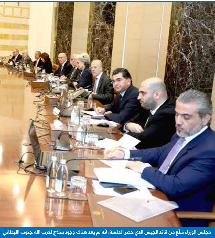
مجلس الوزراء تبلغ من قائد الجيش الذي حضر الجلسة، أنه لم يعد هناك وجود سلاح لحزب الله جنوب الليطاني

وكشف المصدر أنّ مجلس الوزراء تبلغ من قائد الجيش رودولف هيكل الذي حضر الجلسة في شكل عملي وواقعي، أنه لم يعد هناك وجود سلاح لحزب الله جنوب الليطاني، أما شمال الليطاني فبقي الأمر مموها في عبارات عدة أهمها ما قاله رئيس الجمهورية في الجلسة من أن الملف «سيُعالج» في وقته، وقد أكد هيكل في مداخلته أنّ الجيش نفّذ في جنوب الليطاني 5000 مهمة منذ التوصل لوقف النار 2500 منها نفّذها بمفرده والبقية نفّذها بالتعاون والتنسيق مع قوات «اليونيفيل»، وقد أنهى الجيش مهماته في 90 في المئة جنوب الليطاني وبقيت نسبة 10 في المئة وهي القرى والبلدات على الحافة الأمامية من الحدود، حيث تمنع إسرائيل دخول الأهالي والجيش إليها. والخلاصة، قال المصدر الوزاري، أنّ ملف السلاح اصبح على طاولة البحث في مقاربة أولية.