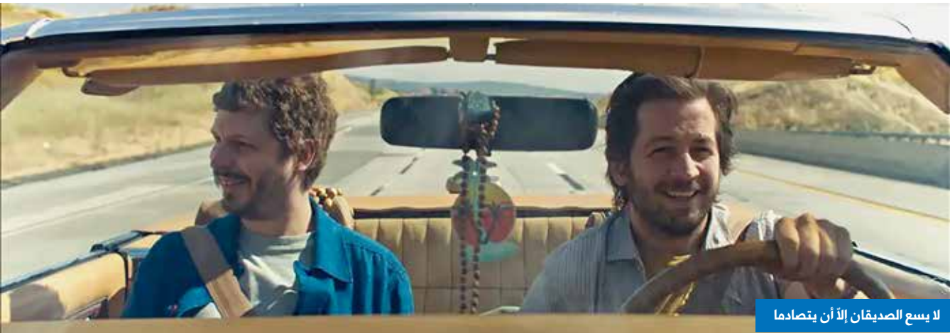
لا يسع الصديقان إلا أن يتصادما