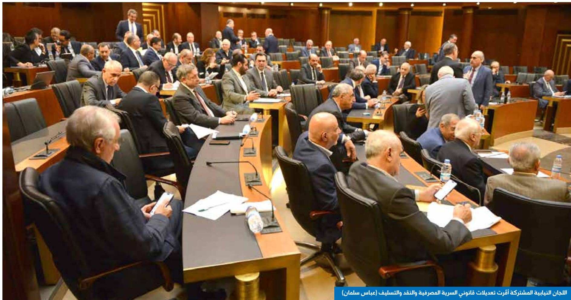
اللجان الثنائية المشتركة أقرت تعديلات قانوني السرية المصرفية والنقد والتسليف (عباس سلمان)

كل كلام في الإعلام حول هذا الأمر، وكما يقول مسؤول كبير لـ«الجمهورية»، «من شأنه أن يفاقم الخلافات ويوسع الهوة بين اللبنانيين، وبالتالي فإن الموقف الصائب عِز عنه رئيس الجمهورية في خطاب القسم وأمام كل الموفدين، بأن هذا السلاح مرتبط حله بحوار داخلي، يفترض أن تتبلور معالمه في المدى القريب المنظور، وموقف المستويات الرسمية جميعها في لبنان خلف رئيس الجمهورية في هذا الأمر».