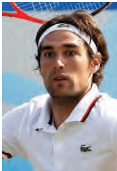
الفرنسي جيريمي شاردي

مشوارهما بمواجهة الجنوب إفريقي لويد هاريس، الصاعد من التصفيات والفائز على الأسترالي كريستوفر أكونيل الصاعد بدوره من التصفيات 7-6 (7-5) و4-6 و6-1، والفرنلندي إميل روسوفوري الصاعد من التصفيات والفائز على الأسترالي جوردان طومسون.