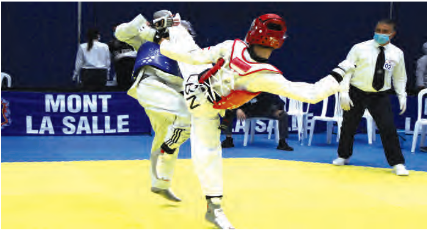
من إحدى المباريات

نظم الاتحاد اللبناني للتايكواندو المرحلة الثانية من الدوري اللبناني للتايكواندو للرجال والسيدات (حزام أسود) على مدى يومين في نادي المون لاسال-عين سعاده.