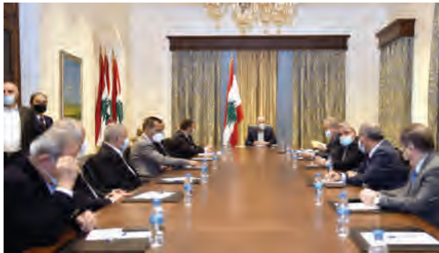
بري مترئسا اجتماع كتلة "التنمية والتحرير" أمس

أكدت كتلة "التنمية والتحرير" برئاسة رئيس مجلس النواب نبيه بري، أن "الحكومة ممر إلزامي لمنع انهيار هيكل الوطن فوق الجميع". وسألت المعنيين بتأليف الحكومة: "فهل أنتم فاعلون؟".