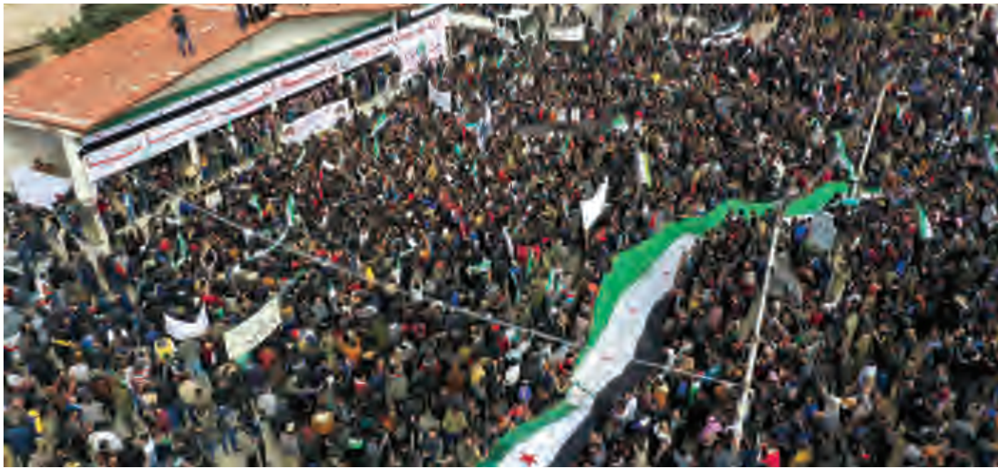
تظاهرات في إدلب لمناسبة مرور 10 سنوات على الاحتجاجات المناهضة للنظام، أمس (أ ف ب)

كما رددوا شعار «الشعب يريد إسقاط النظام»، وهو الهتاف الذي اعتمد في كافة دول الربيع العربي. وحمل بعضهم صوراً لضحايا النزاع. كذلك حمل بعض المتظاهرين العلم السوري الذي اعتمده المعارضة منذ بداية النزاع. وغلقت لافتة كبيرة كتب عليها: «الثورة عهد يتجدد ونصر