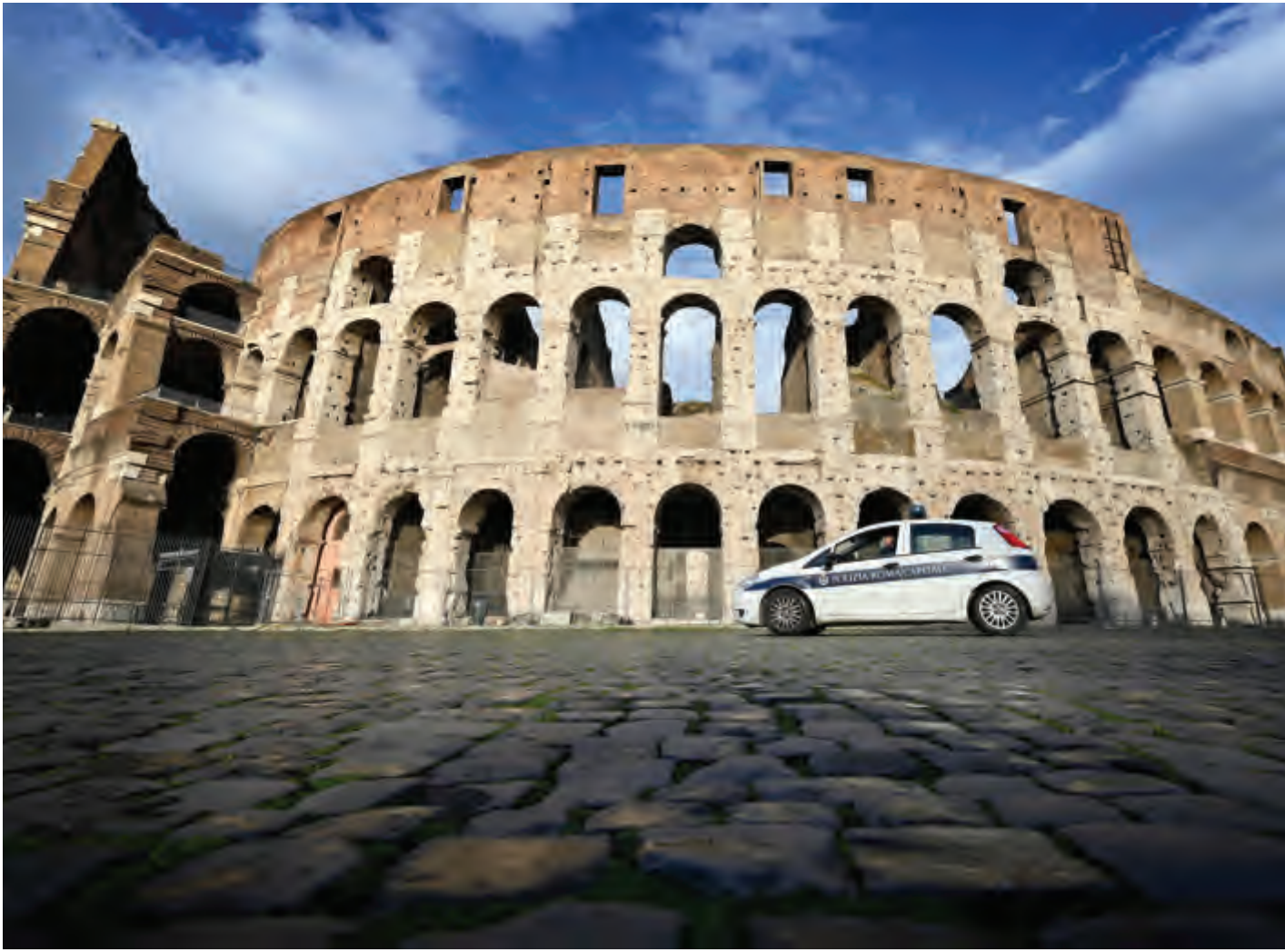
سيارة للشرطة تمر بالقرب من الكوليزيه في روما فيما بدأ المكان خالياً تماماً من الناس

دخلت ثلاثة أرباع مناطق إيطاليا التي تجاوزت عتبة المئة ألف وفاة، في إغلاق جديد أمس في حين خيم القلق في كل من ألمانيا وفرنسا من موجة تالفة من الوباء في أوروبا حيث تسجل مشاكل مع لقاح أسترازينيكا، في حين أعلنت منظمة الصحة العالمية أنّ هيئتها الاستشارية تمحّص التقارير المتعلقة بلقاح "أسترازينيكا"، وأكدت أنه لا توجد أدلة على خلقه أي مشاكل صحية لدى متلقيه.