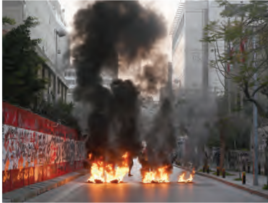
قطع السير أمام مصرف لبنان في الحمراء أمس

وفي المنية، قطع محتجون أوتوستراد البداوي الدولي عن محطة أكومة للمحروقات بإطارات السيارات المشتعلة والحجارة وحاويات النفايات.