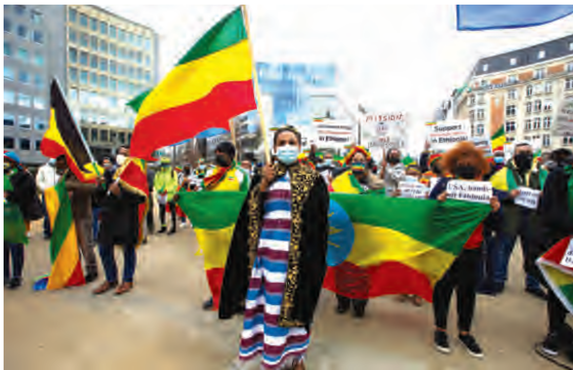
مجموعة من الجالية الأثيوبية في بلجيكا تتظاهر في بروكسل لمطالبة المجتمع الدولي بالاهتمام بالوضع في تيغراي

وأعلن أبيي النصر في 28 تشرين الثاني بعد الاستيلاء على العاصمة الإقليمية ميكيلي، فيما تعهدت جبهة تحرير شعب تيغراي بمواصلة القتال.