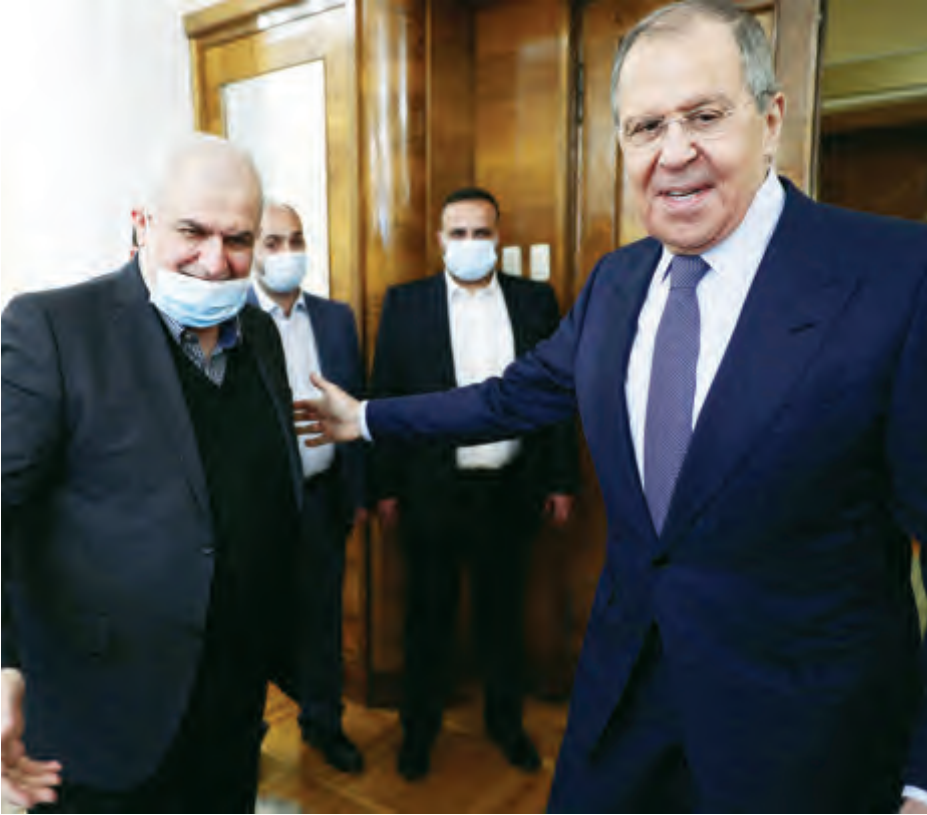
ليس دقيقاً أنّ أولوية النقاش بين الروس ووفد "الحزب" هي الملف الحكومي

فوق ذلك، يتوقّع هؤلاء المحللون أنّ يكون لروسيا دور في تسهيل استئناف المفاوضات المتوقّفة حالياً بين لبنان وإسرائيل، بحيث لا