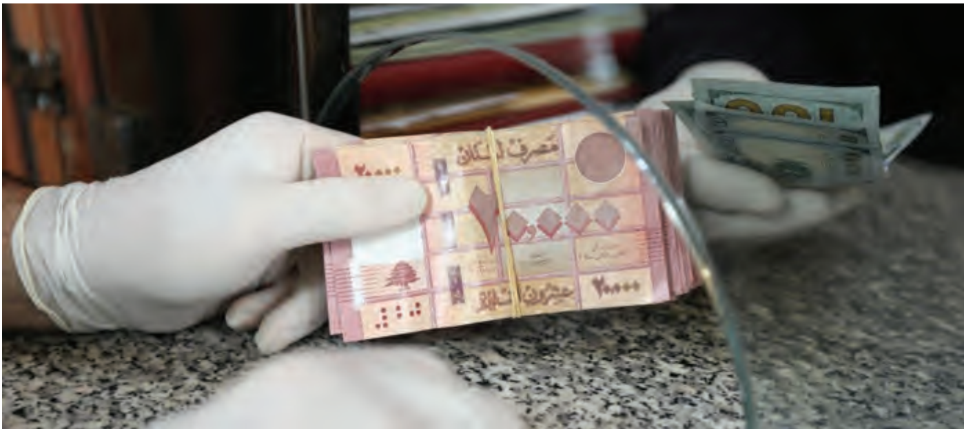
هل تخفتي تحت ضغط الانهيار؟