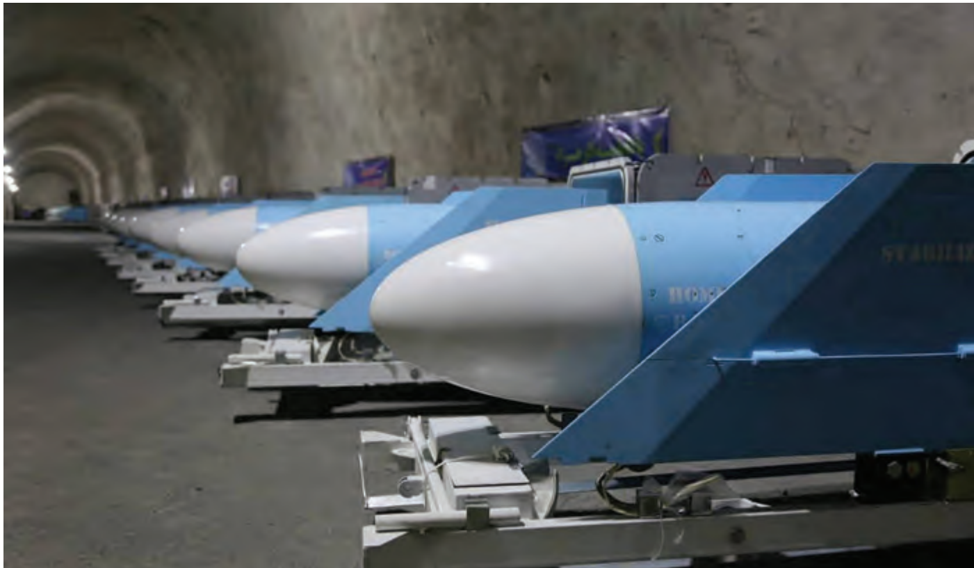
صواريخ لـ «الحرس الثوري» في موقع تحت الأرض غير معروف في الخليج.

أكد وزير الخارجية الإيرانية محمد جواد ظريف، أمس، أنّ الوقت حان لكي تقرر الولايات المتحدة إذا كانت ترغب في التوصل إلى «تسوية» لكسر الجمود وإحياء الاتفاق النووي مع طهران.