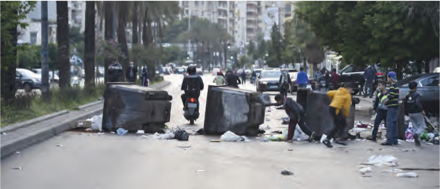
من الاحتجاجات في كورنيش المزرعة أمس

عما اذا كان في الاقف يصبص امل في بلوغ تفاهم حكومي، فقال، يجب الا نقطع الامل، فيمكن ان تبرز الحلول في اي لحظة.