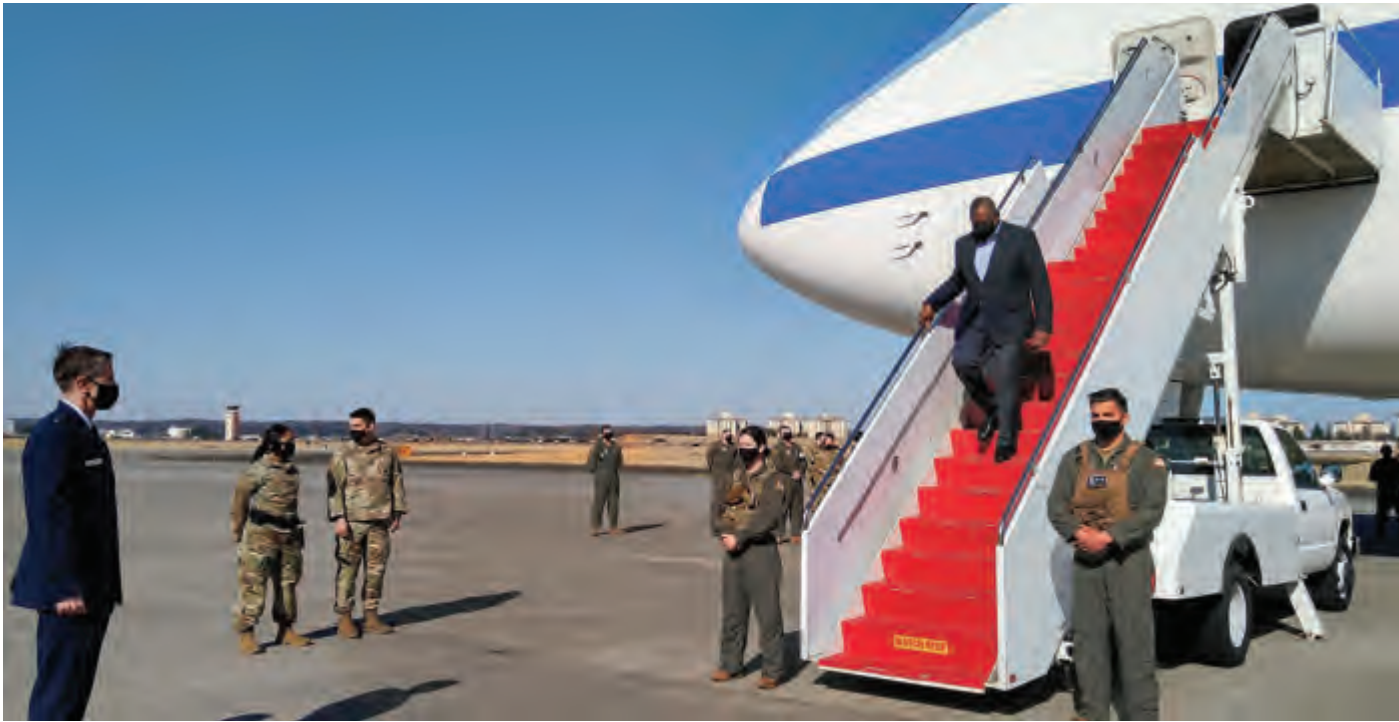
أوستن لدى وصوله الى قاعدة بوكوتا الأميركية الجوية في طوكيو

بدأ وزير الدفاع الأميركي لويد أوستن ووزير الخارجية أنتوني بلينكن زيارة إلى اليابان أمس، في مستهل أول جولة خارجية لهما، في مسعى لكسب تأييد أبرز الحلفاء الآسيويين في مواجهة الصين.