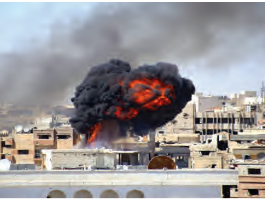
وفد "حزب الله" في موسكو في الذكرى العاشرة للحرب السورية

المعادلة، تعود المراجعة حول هذه الزيارة الى النقطة الصفر. لكن ذلك لا يحول دون ان يكون المستجد على الساحة اللبنانية مدار اهتمام في لقاءات الوفد. ففي ظل فقدان البرنامج النهائي للزيارة واقتصارها على المحادثات الدبلوماسية والسياسية التي سيجزئها الوفد في وزارة الخارجية وتحديداً مع بوعدانوف، فهي تحتمل ان تتوسع لتشمل المسؤولين الكبار في لجنة الشؤون الخارجية في مجلس الانظار مزيد من الوقت لفهم ان تناقش فيه الملفات الداخلية اللبنانية، وعليه، وإبأ كانت المحادثات مع اعضاء الوفد، فإنّ العودة الى ما عبّرت عنه الخارجية الروسية من اهتمام بالشأن الداخلي اللبناني، توحى أنّ موسكو ليست بعيدة عمّا تضمنته «المبادرة الفرنسية». ففي البيان الأخير الذي صدر عنها عقب اللقاء بين لافروف والرئيس سعد الحريري «استعاره» تعابير من المبادرة