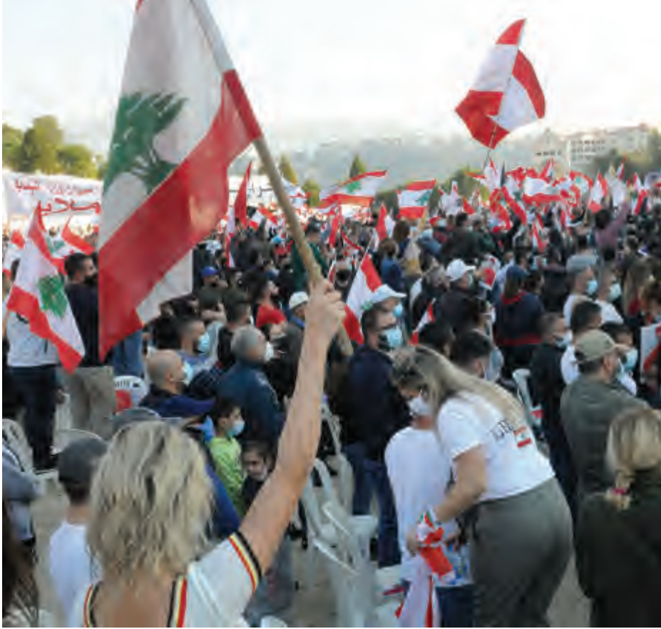
طرح بكركي هو الأسلم والأسرع لمعالجة المعضلة اللبنانية